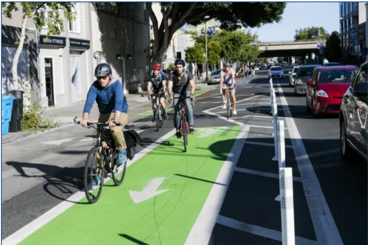
Bild 3: Protected Bike Lane in San Francisco, USA in der 7th Street

Ausführungen von Geschützten Radfahrstreifen in verschiedenen Varianten gibt es inzwischen weltweit, beispielsweise in Vancouver, Montreal und Buenos Aires. Auch viele große chinesische Städte, z.B. Guangzhou und Shanghai, investieren stark in entsprechende Infrastrukturformen und in Europa wenden u.a. London, Sevilla und Paris erfolgreich Variationen davon an.