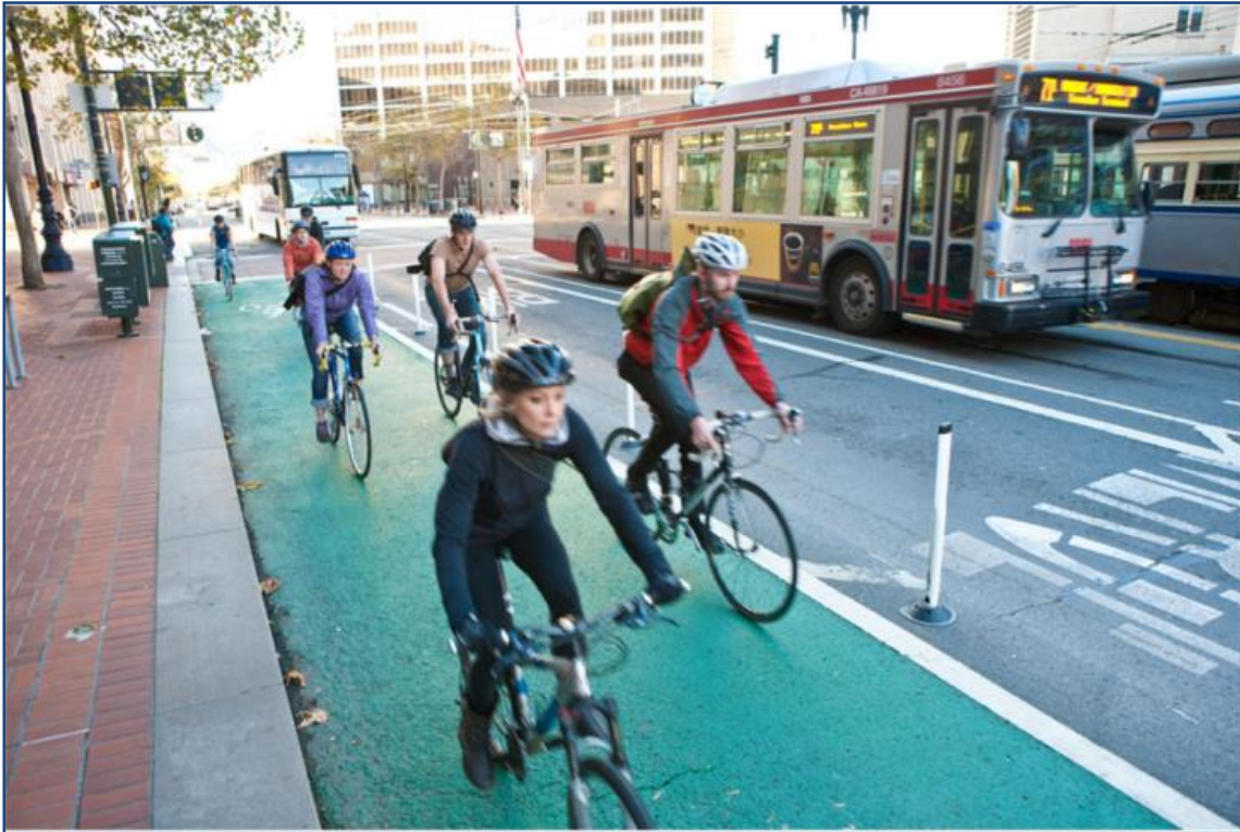
Bild 8: People for Bikes, Protected Bike Lane in San Francisco (USA), Ausstattung mit Flexposts