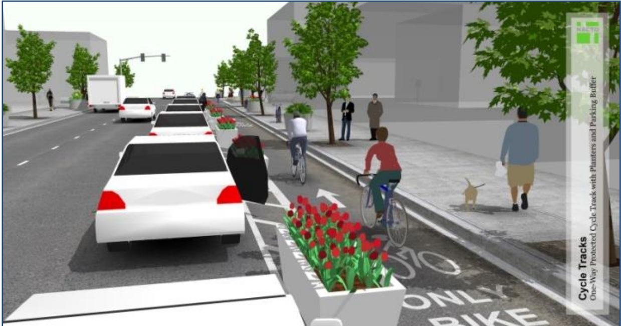
Bild 12: Animation einer One-Way Protected Bike Lane

Nachteil dieser Lösung ist, dass der Radverkehr nicht im direkten Sichtkontakt zum fließenden Kfz-Verkehr geführt wird. Daher sind vorzugsweise durchgehende Straßen mit wenigen Unterbrechungen durch Einfahrten oder einmündende Seitenstraßen geeignet. Der Radverkehr muss im Kreuzungsbereich rechtzeitig wieder ins Sichtfeld gerückt werden. Ebenso wie bei der Trennung von der Kfz-Fahrspur kommen auch hier abmarkierte Sperrflächen zum Einsatz und werden flexible Leitpfosten oder andere physische Elemente installiert.