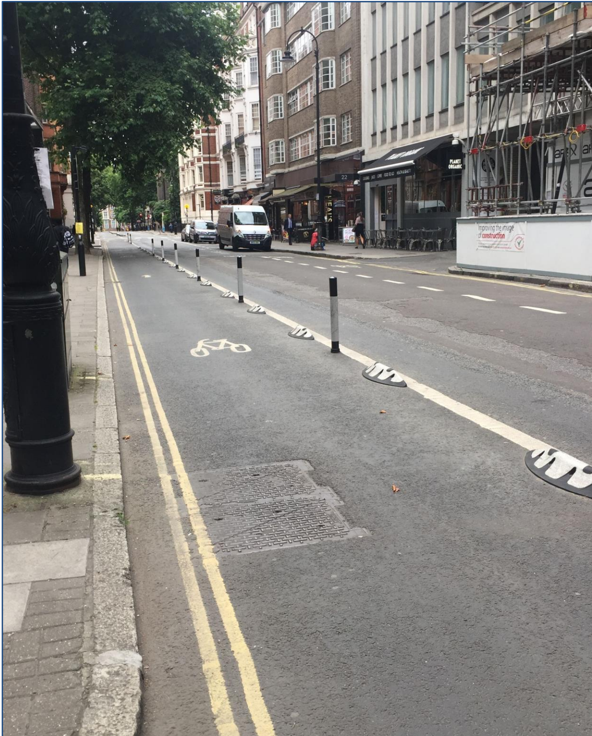
Bild 10: Geschützter Radfahrstreifen in London (UK): Kombination mit flexiblen Leitpfosten und Armadillos, Ausführung ohne Schutzzone (Sperrfläche), Sicherheitsabstand nicht gewährleistet

Armadillos sind flache Trennelemente, die u.a. in Spanien, UK und den USA verwendet werden. In der Praxis hat sich aber bereits gezeigt, dass sich diese wegen der geringen Höhe nur mäßig eignen, um das Überfahren und Beparken von Radfahrstreifen zu verhindern.