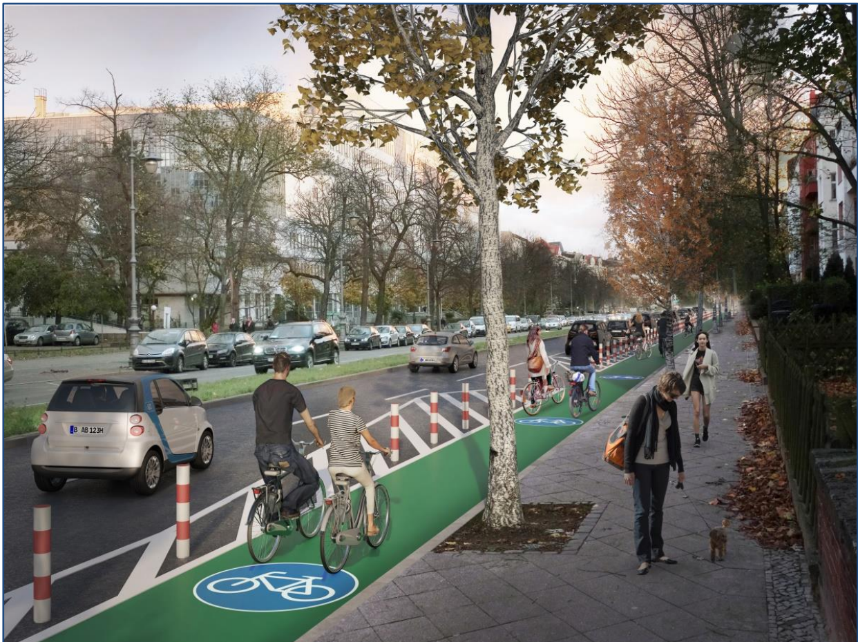
Bild 1: Visualisierung der Planungen für die Umgestaltung der Hasenheide in Berlin