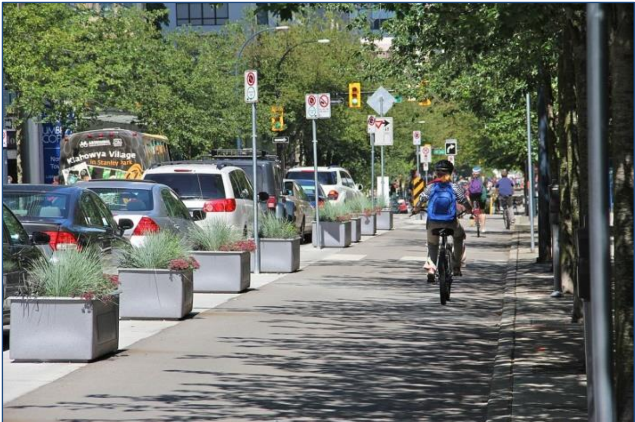
Bild 11: Protected Bike Lane mit Pflanzkübeln in Vancouver (Canada)

In den USA ist diese Variante am beliebtesten bei den Nutzern 15 .