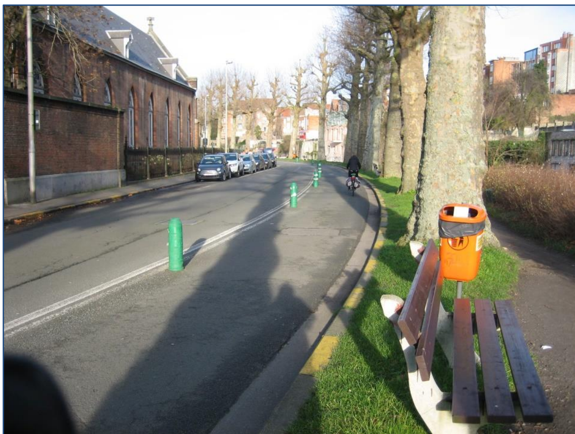
Bild 5: ADFC / Bertram Giebeler, Geschützter Radfahrstreifen in Gent (Belgien)