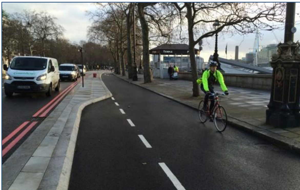
Bild 4: Transport for London (TfL), Super Cycle Highway in London (UK) Variante als innerstädtische Radschnellwegführung mit angeschrägter Bordsteinkante zur Verringerung der Sturzgefahr