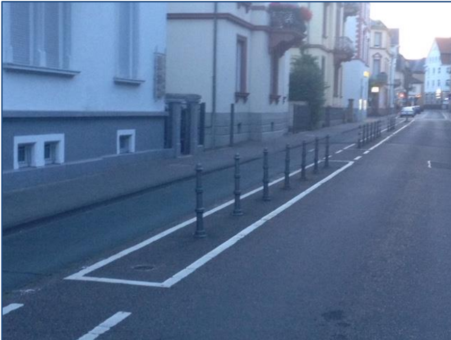
Bild 6: Geschützter Radfahrstreifen in Friedberg, Variante mit Pollern als Trennelement

In Deutschland gibt es, bis auf einige wenige Ausnahmen (siehe Bild 6), keine Erfahrungen mit den Anwendungsmöglichkeiten von Geschützten Radfahrstreifen.