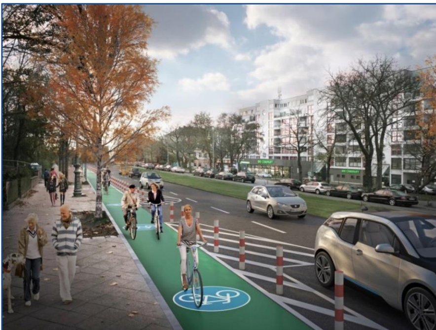
Bild 7: Visualisierung der Planungen für die Umgestaltung der Hasenheide in Berlin

In einigen Städten, darunter Berlin, Köln, Osnabrück und Düsseldorf, gibt es aber aktuell, angeregt durch den ADFC und andere Radverkehrsakteure, Pläne für Modellvorhaben zur Erprobung von Geschützten Radfahrstreifen. Am weitesten fortgeschritten sind die Planungen in Berlin. Dort wird die Senatsverwaltung für Umwelt, Verkehr und Klimaschutz 2018 mit der Umgestaltung von Teilen der Stromstraße, der Karl-Marx-Straße und der Hasenheide beginnen, weitere Erprobungen an anderen geeigneten Straßen sollen folgen.