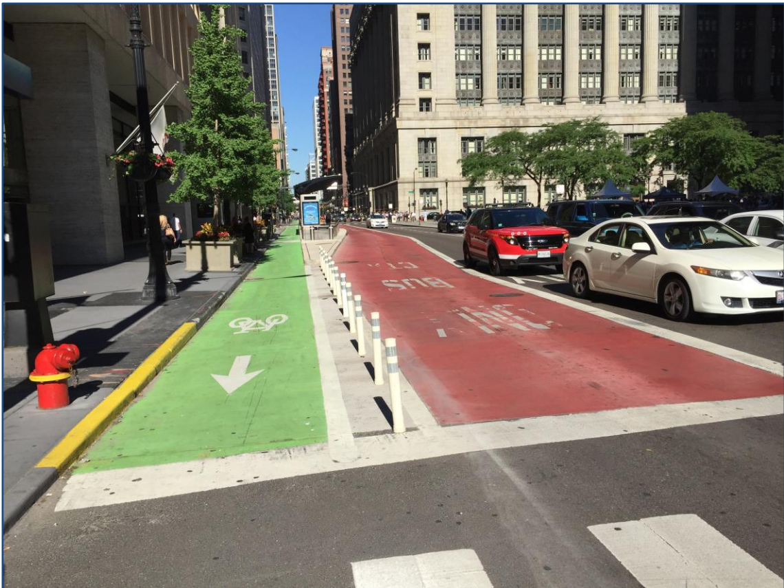
Bild 9: Protected Bike Lane in Chicago (USA), ausgestattet mit Flexposts neben einer Busspur und weiteren Kfz-Fahrspuren